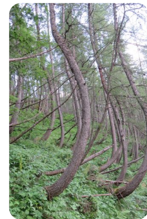
Dans les zones pentues, les arbres maintiennent les sols par leurs racines, réduisent le ruissellement, s'opposent à l'érosion des sols, freinent le glissement du manteau neigeux, et réduisent les avalanches et les glissements de terrain... au grand bénéfice des populations qui vivent en aval.