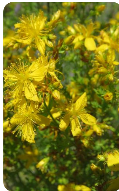
Le millepertuis est connu depuis l'antiquité pour combattre l'anxiété et la dépression... Ces produits dangereux ne permettent pas d'automédication !

Ces précédents exemples illustrent une catégorie particulière, (les « biens matériels »), de ce que les scientifiques appellent des « Services écosystémiques » (SES), c'est-à-dire des bienfaits retirés par les humains du fonctionnement des écosystèmes. Or il existe de nombreux autres SES dont nous avons peu conscience et qui sont pourtant essentiels à notre survie : il s'agit des « services de régulation » et des « apports immatériels ». Les principaux services de régulation, tous gratuits, sont les suivants :