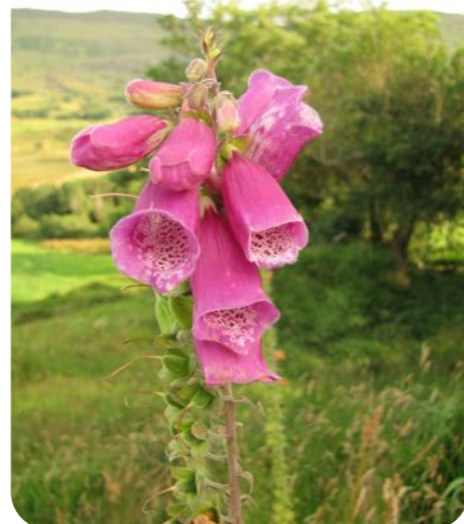
La plupart de nos médicaments sont, au moins à l'origine, issus de plantes sauvages : par exemple, de la digitale pourpre est extraite la digitaline, produit cardiotonique utilisé pour traiter l'insuffisance cardiaque.

chique d'automne, la squalamine (utilisée contre le cancer de la prostate) d'un requin, la pénicilline (le premier antibiotique) d'un champignon (le Penicillium), l'AZT (utilisé contre le Sida) d'une éponge marine (Cryptothetia) et le vaccin antivariolique du virus de la vaccine (maladie des vaches).