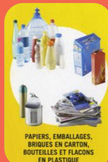
PAPERS, EMBALLAGES, BRIQUES EN CARTON, BOUTEILLES ET FLACONS EN PLASTIQUE

Grâce aux gestes de tri quotidien, nous agissons en faveur de l'environnement et de la préservation des ressources naturelles.