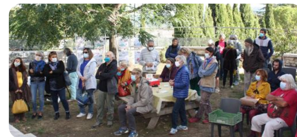
Inauguration de la grainothèque et dessins autour de la nature effectués avec les écoles maternelles. Au cours de l'année scolaire, toutes les classes travailleront autour de la biodiversité.