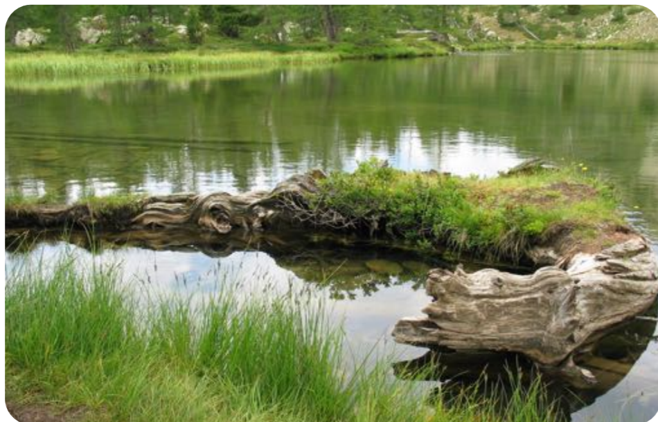
Les zones humides, riches d'une grande biodiversité (plantes aquatiques, mousses et sphaignes, amphibiens, poissons, oiseaux...) rendent de multiples services aux sociétés humaines : épuration et filtration des eaux, alimentation des nappes phréatiques, absorption des crues et régulation des étiages des rivières.

C'est maintenant une évidence : le climat change, les ressources en eau diminuent et se partagent entre des usages toujours plus nombreux, chaque année émergent de nouvelles maladies ou ravageurs (mouche suzukii, pyrale du buis). Il est donc essentiel pour notre survie de préserver nos collections variétales mais aussi la diversité de leurs « parents sauvages » qui abritent des gènes dont nous pourrions avoir besoin.