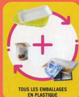
TOUS LES EMBALLAGES EN PLASTIQUE