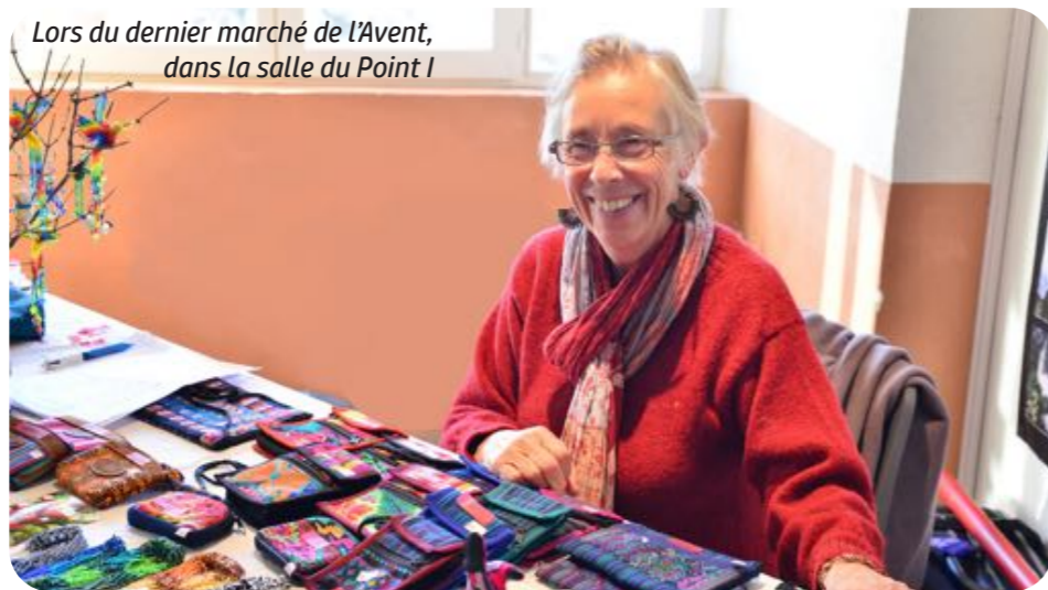
Lors du dernier marché de l'Avent, dans la salle du Point I