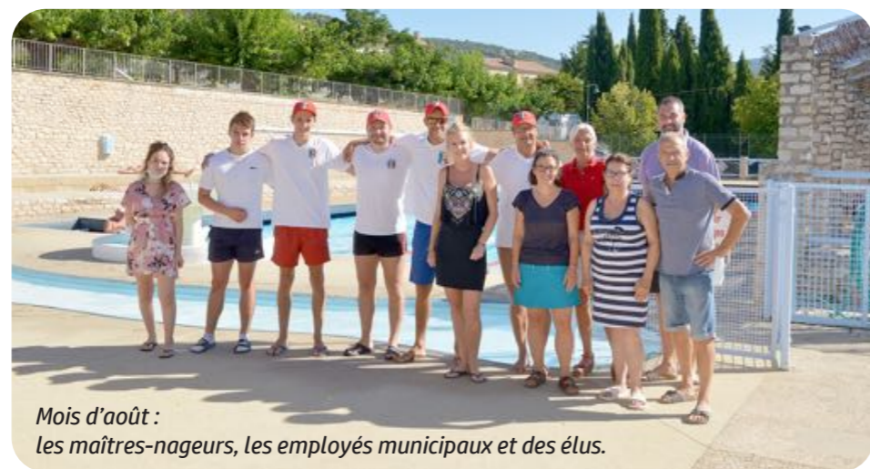
Mois d'août : les maîtres-nageurs, les employés municipaux et des élus.