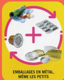
EMBALLAGES EN MÉTAL, MÊME LES PETITS

DÉSORMAIS TOUS LES EMBALLAGES SE TRIENT AUSSI DANS LE BAC JAUNE !